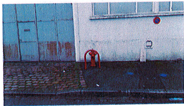
PHOTO DE L'HYDRANT

Critère de conformité Nature du risque Bâtiment à risque courant ordinaire Durée 2 h Débit 60 m3/h